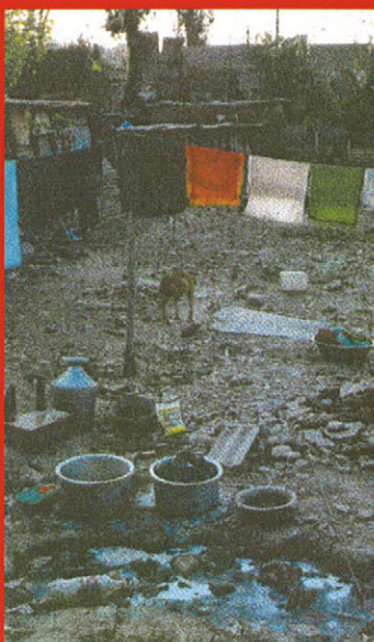
Auch das ist Nepal!

Global Family hilft einer Mutter und ihren drei Kindern, die auf dieser Mülldeponie wohnen.